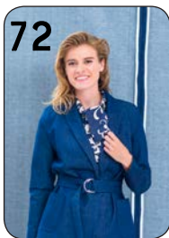
JASJE 2: STRETCHDENIM (POLYTEX STOFFEN).