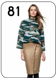
TRUI 22: CAMOUFLAGEBREISEL ROK 24: IMITATIELEER MET STRUCTUUR (BEIDE VAN NOOTEBOOM).