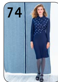
JURK 9: TRICOT MET JEANSLOOK EN BLOEMEN-PRINTJE (TOPTEX).