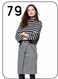
TRUI 22: GESTREEPT BREISEL ROK 24: STRETCHSTOF MET DE PIED DE POULE-PRINT (BEIDE VAN NOOTEBOOM).