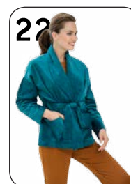
JASJE 20: BREDE RIBFLUWHEEL (HILCO).