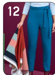
BROEK 5: GABARDINE MET STRETCH (NOOTEBOOM).