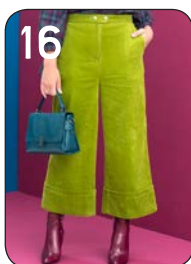
BROEK 16: RIBFLUWHEEL (HILCO).