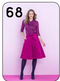
TOP 11: VISCOSE TRICOT MET PRINT (TST STOFFEN). ROK 8: SATIJKATOEN MET STRETCH (TST STOFFEN).