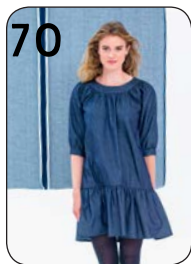
JURK 12: STRETCHDENIM (POLYTEX STOFFEN).