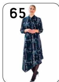
JURK 10: WARME TRICOT VAN VISCOSE POLYESTER (HILCO).