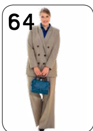
JASJE 1 EN BROEK 15: GEMÉLEERDE GABARDINE MET STRETCH (NOOTEBOOM).