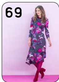
JURK 10: VISCOSE TRICOT (TST STOFFEN).