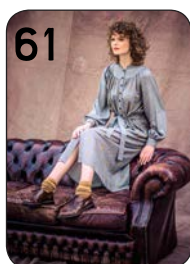
JURK 13: GERUIITE VISCOSE-CRÉPE (TOPTEX).