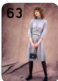
JURK 3: GERUIITE STRETCH-VISCOSE (TOPTEX).