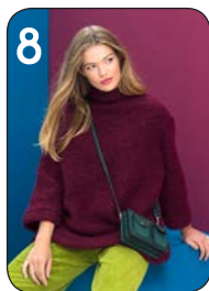
TRUI 23: GEBREIDE WOL-MIX (TOPTEX). BROEK 16: RIBFLUWHEEL (HILCO).