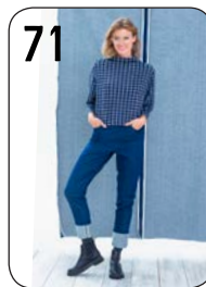
TOP 22: BEDRUKTE JOGGING-STOF (NOOTEBOOM) + BROEK (POLYTEX-STOFFEN). 6: STRETCHDENIM (POLYTEX STOFFEN).