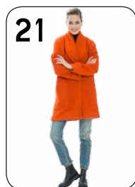
JAS 19: WOL MET POLYESTER (NOOTEBOOM).