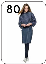
TRUI 22: WINTERTRICOT ROK 24: STRETCHDENIM (BEIDE VAN NOOTEBOOM).