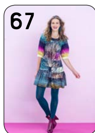
JURK 12: STRETCHSATIJKATOEN (TST STOFFEN).