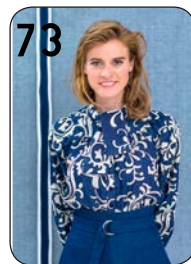
BLOUSE 14: GEBORDURDE CHAMBRAY (NOOTEBOOM). ROK 7: STRETCHDENIM (POLYTEX STOFFEN).