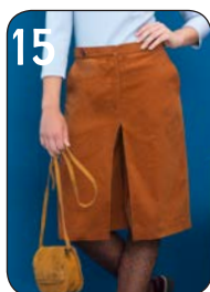
BROEKROK 17: STRETCH-VELOURS (TOPTEX).