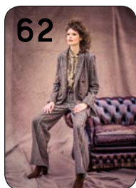
JASJE 1 + BROEK 15: GERUIITE WOL MET POLYESTER (HILCO).