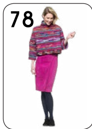
TRUI 22: GROF MULTI-COLOUR BREISEL (NOOTEBOOM). ROK 24: STRETCH-RIBFLUWHEEL (NOOTEBOOM).