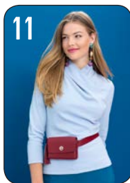
TOP 11: PUNTA DI ROMA (VISCOUNT).