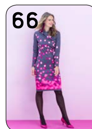
JURK 9: PUNTA DI ROMA PANELSTOF (TST STOFFEN).