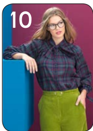
BLOUSE 14: GERUIITE VISCOSE (VISCOUNT).