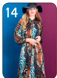
JURK 13: POLYESTER MET FLORALE PRINT (MARVIC).