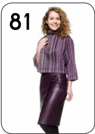
TRUI 22: WOLVILT MET GEBORDURD DRADENDESSIN ROK 24: IMITATIELEER MET STRETCH (BEIDE VAN NOOTEBOOM).