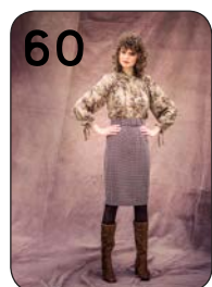
BLOUSE 14: VISCOSE MET PRINT (TOPTEX) + ROK 25: GERUIITE WOL-POLYESTER (VISCOUNT).