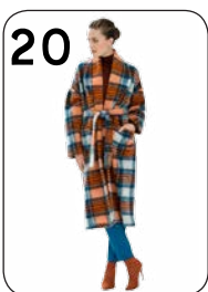
STOF JAS 18: WOLLIGE MANTELSTOF (HILCO).