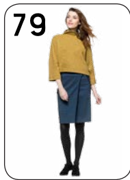
TRUI 22: GEMÉLEERDE WINTERTRICOT ROK 24: STRETCHSTOF MET PIED DE POULE-PRINT (BEIDE VAN NOOTEBOOM).