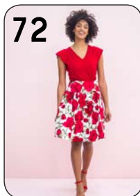
72 TOP 24: VISCOSE-TRICOT (NOOTEBOOM). ROK 17: GEBLOEMDE STRETCH-KATOEN (VISCOUNT).