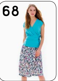
68 TOP 11: STRETCHCRÈPE (VISCOUNT). ROK 10: KATOEN MET PRINT (TOPTEX).