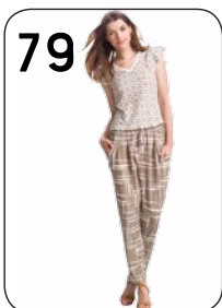
79 BROEK 22: RELIËFTRICOT MET GRAFISCH DESSIN (NOOTEBOOM). TOP 24: RELIËFTRICOT MET GRAFISCH DESSIN (NOOTEBOOM).