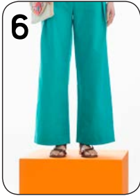
6 BROEK 3: LINNEN-KATOEN (VISCOUNT).