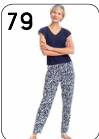
79 BROEK 22: TRICOT MET ZEBRAPRINT (NOOTEBOOM). TOP 24: GESTIPPELDE TRICOT (NOOTEBOOM).