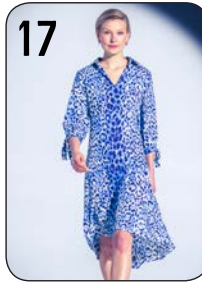
17 JURK 21: CRÈPE MET PANTER-PRINT (HARRIE BOSCH).