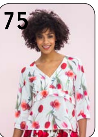
75 TOP 6: GEBLOEMDE POLYESTER MET STRETCH (NOOTEBOOM).