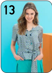
13 BLOUSE 8: ZIJDE-VISCOSE MET DASPRINT (TOPTEX).