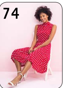
74 JURK 12: STIPPENVISCOSE-TRICOT (NOOTEBOOM).