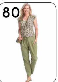
80 BROEK 22: GROENE TRICOT (NOOTEBOOM). TOP 24: TRICOT MET ZWART-DESSIN (NOOTEBOOM).