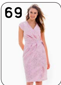
69 JURK 9: METALLIC JACQUARD (NOOTEBOOM).