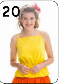
20 TOP 20: DUNNE JOGGINGSTOF (NOOTEBOOM).