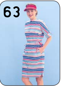
63 JURK 16: KATOEN (HILCO).