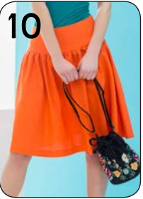
10 ROK 17: LINNEN (NOOTEBOOM).