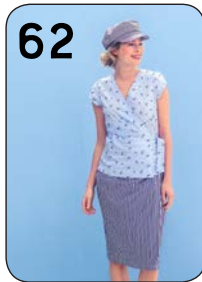
62 TOP 11: STRETCHKATOEN (QUALITY TEXTILES). ROK 10: KATOEN (NOOTEBOOM).