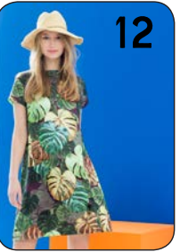
12 JURK 7: KATOENZIJDE MET BLADPRINT (TOPTEX).