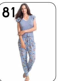
81 BROEK 22: TRICOT MET ROZENPRINT (NOOTEBOOM). TOP 24: TRICOT MET TAKJESPRINT (NOOTEBOOM).