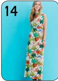
14 JURK 13: TRICOT MET PRINT (NOOTEBOOM).