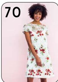
70 JURK 7: GEBORDUURD KANT (NOOTEBOOM).