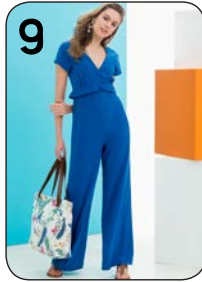
9 JUMPSUIT 5: ZOMERCRÈPE MET STRETCH (NOOTEBOOM).