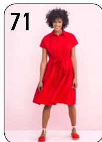
71 JURK 15: PIQUÉKATOEN (TOPTEX).