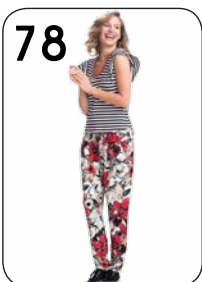
78 BROEK 22: TRICOT MET BLOEMEN (NOOTEBOOM). TOP 24: GESTREEPTE TRICOT (NOOTEBOOM).