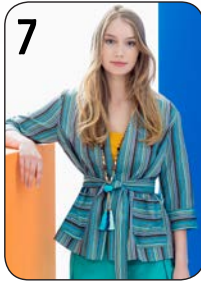
7 JASJE 1: GEWEVEN STREEP (NOOTEBOOM).