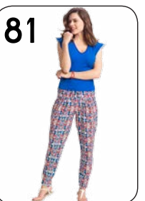
81 BROEK 22: POLYESTER TRICOT MET MOZAIËKPRINT (NOOTEBOOM). TOP 24: TRICOT MET STIPPENPRINT (NOOTEBOOM).