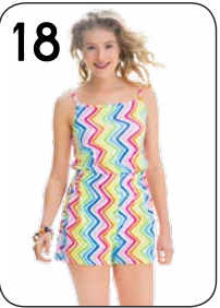
18 JUMPSUIT 19: SOEPELE VISCOSE-TRICOT (NOOTEBOOM).