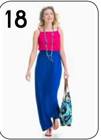
18 JURK 18: BLAUWE EN ROZE VISCOSE-TRICOT (NOOTEBOOM).