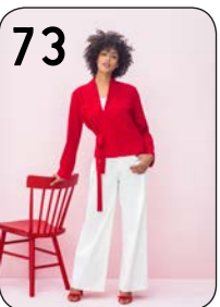
73 JASJE 2: VISCOSE-CRÈPE (NOOTEBOOM). BROEK 3: STRETCH-KATOEN (NOOTEBOOM).