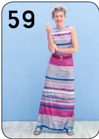
59 JURK 13: VISCOSE-TRICOT (HILCO).