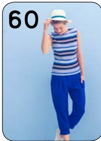
60 TOP 14: RIBTRICOT (NOOTEBOOM). BROEK 23: DUNNE JOGGING (NOOTEBOOM).