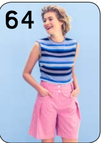
64 TOP 14: RIBTRICOT (NOOTEBOOM). BERMUDA 4: KATOEN (POLYTEX STOFFEN).