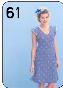
61 JURK 25: KATOENEN TRICOT (NOOTEBOOM).