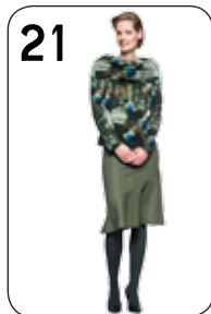
21 TRUI BONNE 25: PUNTA DI ROMA (NOOTEBOOM). ROK JARA 24: GROENE RELIEF-TRICOT (NOOTEBOOM).