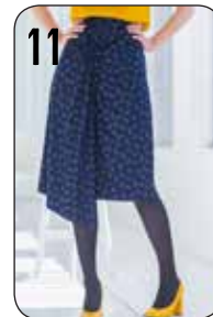
11 ROK EDITH 1: TRICOT (NOOTEBOOM).