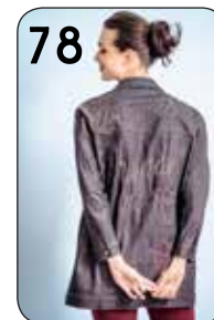
78 JACK 23: JEANS (NOOTEBOOM)