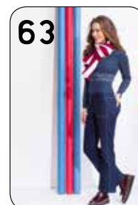
63 TOP TINKA 6: RIB KLEINE STIP (NOOTEBOOM) + KATOEN GROTE STIP (POLYTEX). BROEK BRITTA 20: STRETCH-JEANS (BURTEX).