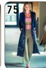
75 JAS SUZY 9: WOL MET ZUIDEN BORDUURSEL (TST STOFFEN). BROEK AMBER 4: STRETCH-GABARDINE (NOOTEBOOM).