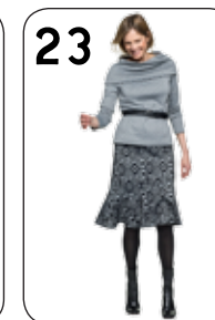
23 TRUI BONNE 25: PUNTA DI ROMA MET FLOCK-STIPPEN (NOOTEBOOM). ROK JARA 24: PUNTA DI ROMA MET FLOCK-DESSIN (NOOTEBOOM).