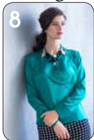
8 BLOUSE LAURA 13: STRETCH-SATUN (BURTEX).