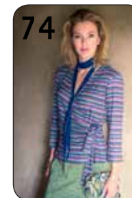
74 TOP KIKI 14: GESTREEPT BREISEL (NOOTEBOOM). ROK KLASKE 12: TRICOT MET RUITPRINT (BURTEX).