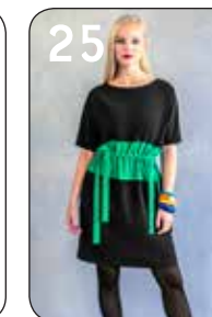
25 JURK JOANNE 27: POLYESTER CRÉPE (NOOTEBOOM)