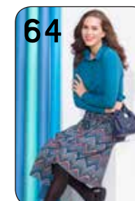
64 POLOTOP JOYCE 11: TRICOT MET PRINT (NOOTEBOOM). ROK LISANNE 2: TRICOT MET ETNISCHE PRINT (NOOTEBOOM).