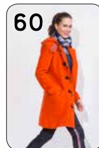
60 JAS ELINE 8: ORANJE GEKOOKTE WOL (NOOTEBOOM).