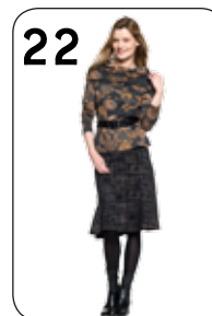
22 TRUI BONNE 25: PUNTA DI ROMA MET BLOEMENPRINT (NOOTEBOOM). ROK JARA 24: PUNTA DI ROMA MET RUITPRINT (NOOTEBOOM).