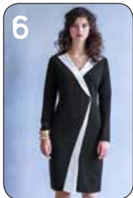
6 JURK LOES 23: ZWARTE + WITTE STEVIGE RIBBELTRICOT (QUALITY TEXTILES).