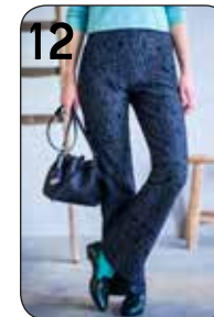
12 LEGGING JACQUELINE 21: PUNTA DI ROMA MET PRINT (NOOTEBOOM).