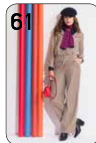
61 JUMPSUIT JADA 5: TENCEL (TST STOFFEN).