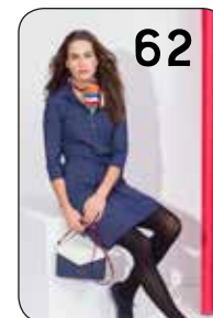
62 JURK JANTIENE 10: STRETCH-LYCYRA (POLYTEX).