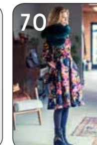
70 JURK LOLA 15: KATOEN/VISCOSE MET BLOEMENWEEFSEL (NOOTEBOOM).