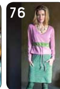
76 TOP TINKA 16: ROZE + GROENE PUNTA DI ROMA (POLYTEX + NOOTEBOOM). ROK KLASKE 12: TRICOT MET RUIT-PRINT (BURTEX).