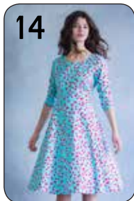
14 JURK LOLA 15: KATOEN MET KERSENPRINT (BURTEX).