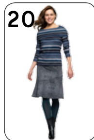
20 TRUI BONNE 25: GESTREEPTE RIBTRICOT (NOOTEBOOM). ROK JARA 24: PUNTA DI ROMA (NOOTEBOOM).