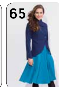
65 JASJE ZOË 7: DOUBLE-FACE SCUBA (POLYTEX). ROK ANNA 17: STRETCH-GABARDINE (NOOTEBOOM).