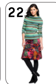
22 TRUI BONNE 25: GESTREEPT BREISEL (NOOTEBOOM). ROK JARA 24: PUNTA DI ROMA MET BOMENPRINT (NOOTEBOOM).