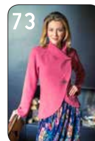
73 JASJE ZOË 7: GEKOOKTE WOL (NOOTEBOOM). ROK GOLDIE 28: GEBLOEMDE PLISSE (TST STOFFEN).