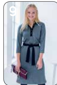
9 JURK JANTIENE 10: DOUBLE-FACE TRICOT (NOOTEBOOM).