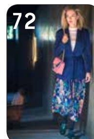
72 JASJE ESTER 19: STRETCH-CRÉPE (TST STOFFEN). ROK GOLDIE 28: GEBLOEMDE PLISSE (TST STOFFEN).