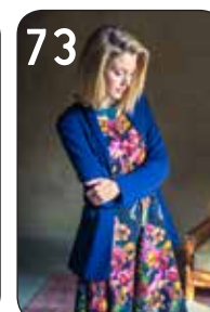
73 JURK LOLA 15: KATOEN/VISCOSE MET BLOEMENDESSIN (NOOTEBOOM). JASJE ESTER 19: STRETCH-CRÉPE (TST STOFFEN).