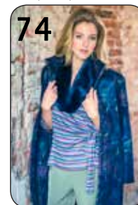
74 JAS SUZY 9: WOL MET ZUIDEN BORDUURSEL (TST STOFFEN). BROEK AMBER 4: STRETCH-GABARDINE (NOOTEBOOM)