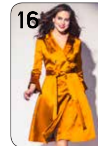
16 JURK DEBORAH 22: STRETCH-SATUN (HARRIE BOSCH).