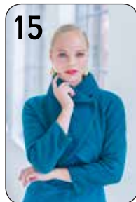
15 BOLEROJASJE ANNECLAIRE 6: GEKOOKTE WOL MET STRETCH (TOPTEX).