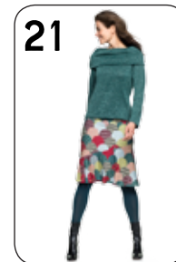
21 TRUI BONNE 25: GEMELEERD BREISEL (NOOTEBOOM). ROK JARA 24: TRICOT MET PATCH-WORK-PRINT (NOOTEBOOM).