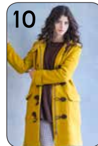
10 JAS ELINE 8: GELE GEKOOKTE WOL MET STRETCH (NOOTEBOOM).