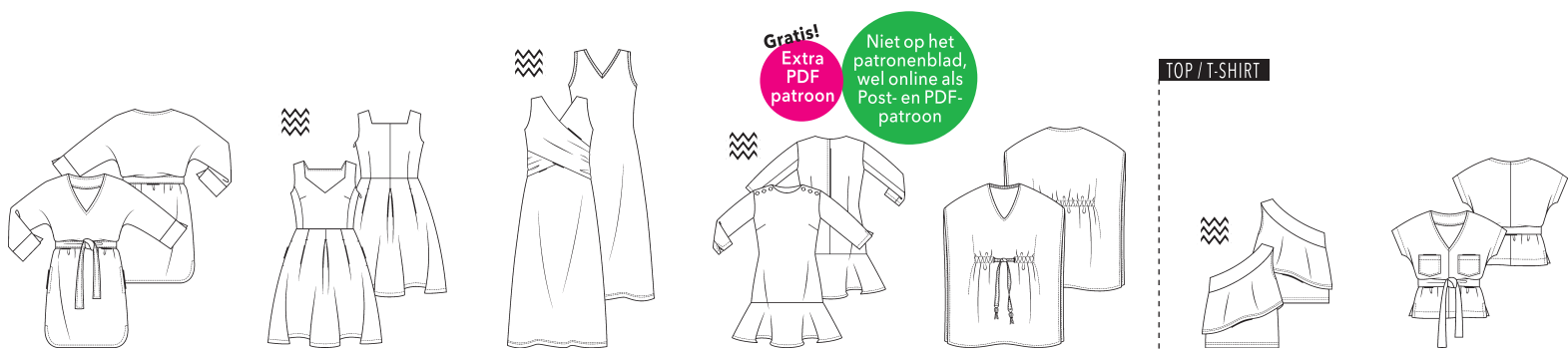
14 TUNIEK ●● maten 34 t/m 54