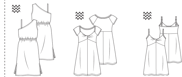
5 JURK ●● maten 34 t/m 54