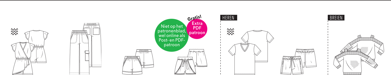
4 JUMPSUIT ●●● maten 34 t/m 54