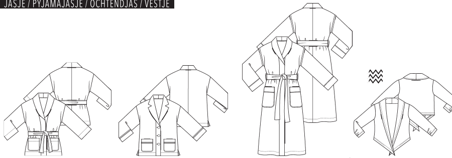
9 JASJE ●●● maten 34 t/m 54