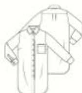
16 JURK ●●● maten 34 t/m 54