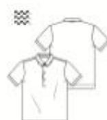
23 POLOSHIRT ●●● maten 46 t/m 58