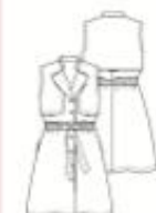
8 JURK ●●● maten 34 t/m 54