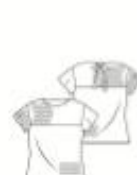
29 TRUI ●●● maten 34 t/m 52