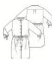
17 JURK ●●● maten 34 t/m 54