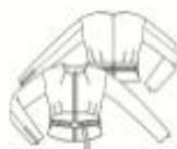
21 JASJE ●●● maten 34 t/m 54