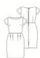
26 JURK ●● maten 34 t/m 54