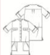
20 JURK ●●● maten 34 t/m 54