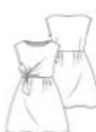
10 JURK ●●● maten 34 t/m 54