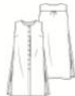
24 LANGE TUNIEK ●● maten 34 t/m 54