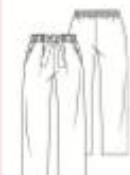
11 BROEK ●● maten 34 t/m 54