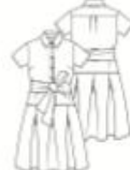
18 JURK ●●● maten 34 t/m 54