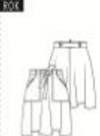
7 ROK ●● maten 34 t/m 54