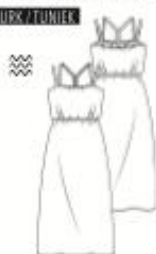
1 JURK ●● maten 34 t/m 54