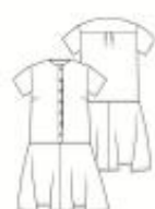
19 JURK ●●● maten 34 t/m 54