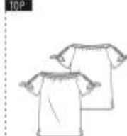
4 TOP ●● maten 34 t/m 54