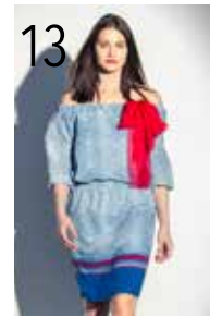
JURK 26: VISCOSE PANELSTOF MET RANDESSIN (WWW.HARRIEBOSCHMODESTOFFEN.NL)