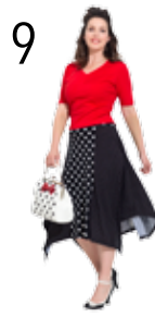
TOP 2: PUNTO MILANO (TOPTEX) ROK 20: TRICOT MET KLEINE EN GROTE STIPPEN (NOOTEBOOM)