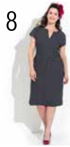
JURK 15: KATOEN MET STIPPEN (NOOTEBOOM)