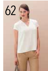
TOP 24: CRÉPE (MARVIC) BROEK 9: KRILTSTREEP (MARVIC)