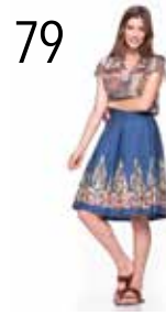
TOP 24: VOILE MET PAISLEYPRINT (NOOTEBOOM) ROK 25: GEBORDUURDE DENIM (NOOTEBOOM)