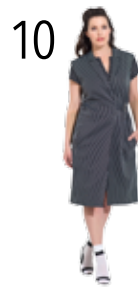
GILET 8: GESTREEPTE STRETCH-STOF (TOPTEX)