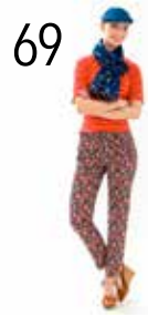
TOP 2: GESTREEPTE TRICOT (NOOTEBOOM) BROEK 9: JACQUARD (TOPTEX)