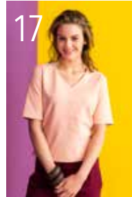
TOP 2: PUNTO MILANO (TST STOFFEN)