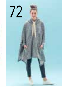
PONCHO 28: GEMÉLEERDE JOGGING (NOOTEBOOM)