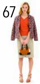
TOP 2: GESTREEPTE TRICOT (NOOTEBOOM) ROK 11: BEIGE DENIM (POLYTEX)