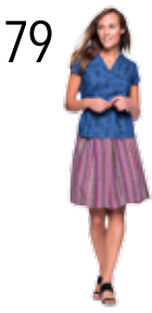
TOP 24: SOEPELE DENIM MET ANANASDESSIN (NOOTEBOOM) ROK 25: INGEGEWEN GESTREEPTE POLYESTER (NOOTEBOOM)