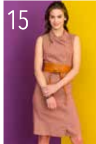
JURK 6: GESTREEPTE STOF (TOPTEX)