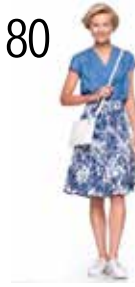
TOP 24: SOEPELE SPIJKERSTOF (NOOTEBOOM) ROK 25: GEBLOEMDE KEPER-KATOEN MET STRETCH (NOOTEBOOM)