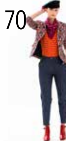
BROEK 4: STRETCH-DENIM (NOOTEBOOM)