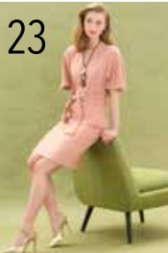
JURK 23: CRÉPE-TRICOT (TOPTEX)