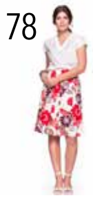
TOP 24: BRODERIE (NOOTEBOOM) ROK 25: LINNENKATOEN MET GROTE BLOEMEN (NOOTEBOOM)