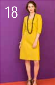
JURK 1: PUNTO MILANO (NOOTEBOOM)