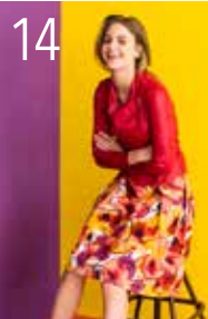
JASJE 5: IMITATIELEER (TST STOFFEN) ROK 25: VISCOSE-LINNEN (NOOTEBOOM)