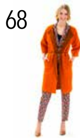
VEST 13: WOLVILT (TST STOFFEN) JASJE 7: JACQUARD (TOPTEX) BROEK 9: JACQUARD (TOPTEX)