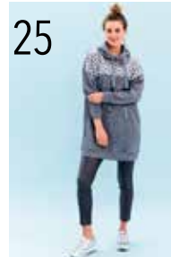
TUNIEK/JURK 21: GLITTER-JOGGING (NOOTEBOOM), PAILLETTENTRICOT (QUALITY TEXTILES) BROEK 22: GECOATE GABARDINE MET STRETCH (NOOTEBOOM)