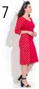
JURK 18: TRICOT MET KLEINE EN GROTE STIPPEN (NOOTEBOOM)