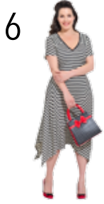
JURK 19: GESTREEPTE JOGGING-TRICOT (TOPTEX) (QUALITY TEXTILES)