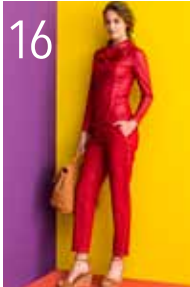
JASJE 5: IMITATIELEER (TST STOFFEN) BROEK 3: STRETCH-DENIM (POLYTEX)