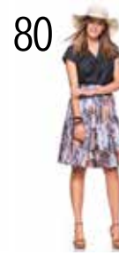
TOP 24: SOEPELE ZWARTE DENIM (NOOTEBOOM) ROK 25: SCUBA MET DIEREN-HUIDENDESSIN (NOOTEBOOM)