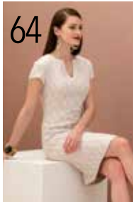
JURK 15: JACQUARD (NOOTEBOOM)