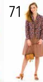
JASJE 7: JACQUARD (TOPTEX) JURK 16: STRETCHSTOF MET DASPRINT (TOPTEX)