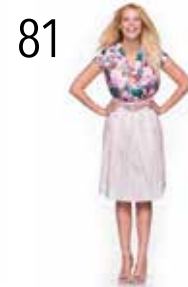
TOP 24: GEBLOEMD SATIJS (NOOTEBOOM) ROK 25: GESTREEPTE LINNEN-KATOEN (NOOTEBOOM)

DE WERK-BESCHRIJVINGEN VAN ALLE MODELLEN VIND JE IN HET WERKSCHRIFT VANAF PAGINA 27