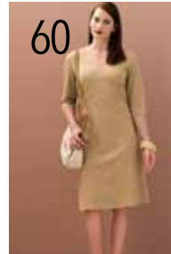
JURK 1: PUNTO MILANO (NOOTEBOOM)