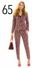
JASJE 7: JACQUARD (TOPTEX) BROEK 9: JACQUARD (TOPTEX)