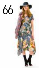
JURK 19: TRICOT PATCHWORK STOF (NOOTEBOOM)