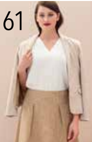
JASJE 7: JACQUARD (NOOTEBOOM) ROK 12: POLYESTER MET LINNEN-LOOK (MARVIC)