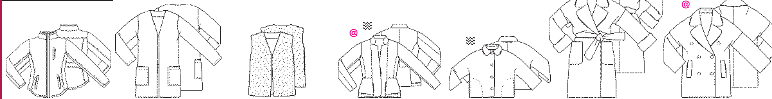
1 JACKJE ●●● MATEN 34 T/M 54