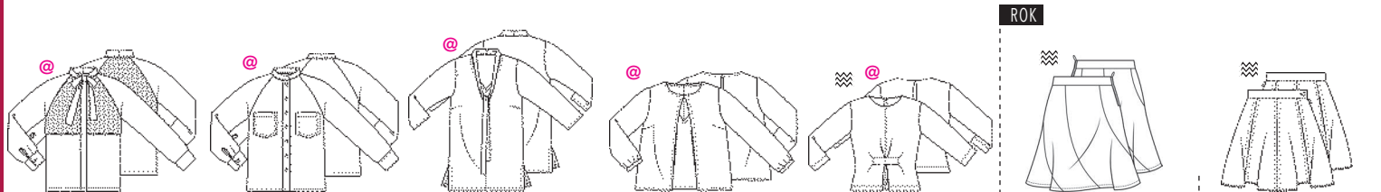
8 BLOUSE ●●● MATEN 34 T/M 54