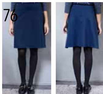
76 ROK 9: GRIJSBLAUWE PUNTA DI ROMA (KNIPIDEE).