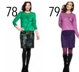
78 SWEATER 24: GROENE FLUFFY TRICOT (NOOTEBOOM). ROK 25: GEBORDUURDE DENIM (NOOTEBOOM).