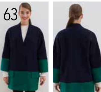
63 JAS 22: GEKOOKTE WOL IN DONKERBLAUW EN FLESSENGROEN (KNIPIDEE).