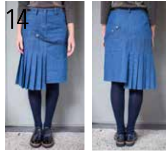
14 ROK 17: DENIM (QUALITY TEXTILES).