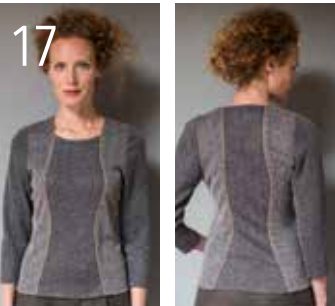
17 TOP 7: DOUBLE FACE-CRËPETRICOT (QUALITY TEXTILES).