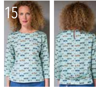
15 TOP 20: SATIJKATOEN MET LIBELLENPRINT (POLYTEX STOFFEN).