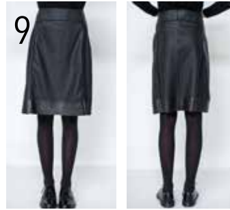
9 ROK 8: GEPERFOREERD IMITATIELEER, GLAD IMITATIELEER (KNIPIDEE).