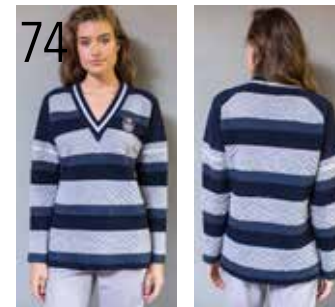
74 SWEATER 5: BANENTRICOT EN DONKERBLAUWE PUNTA DI ROMA (KNIPIDEE).