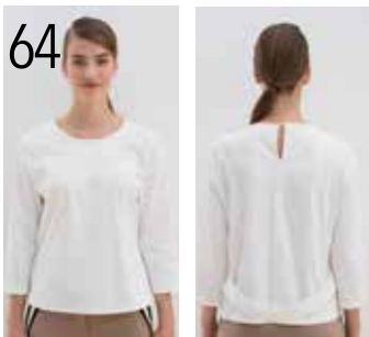
64 TOP 20: OFF WHITE STRETCHSTOF (NOOTEBOOM).