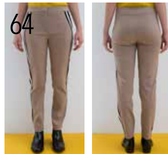
64 BROEK 2: STRETCHSTOF IN CAMEL, ZWART (NOOTEBOOM).