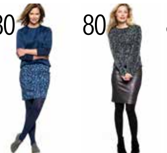
80 SWEATER 24: DOUBLE FACE-FLEECE (NOOTEBOOM). ROK 25: GEVLEKTE STRETCHKATOEN (NOOTEBOOM).