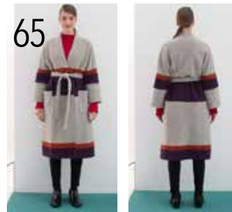
65 JAS 21: GEKOOKTE WOL IN GRIJS, ORANJEROOD, DONKERPAARS (KNIPIDEE).