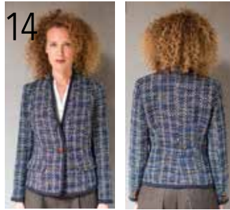
14 JASJE 16: TWEED 'CHANELLA' (KNIPIDEE).