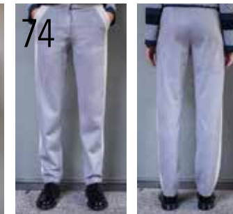
74 BROEK 3: DOUBLE FACE-STRETCHSUËDINE (KNIPIDEE).