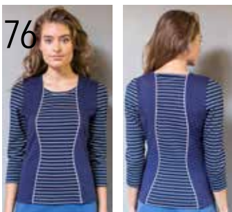
76 TOP 7: GESTREEPTE TRICOT EN DONKERBLAUWE PUNTA DI ROMA (NOOTEBOOM).