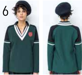
6 SWEATER 5: GROENE SCUBA (NOOTEBOOM), ZWARTE RELIËFTRICOT (TST STOFFEN), ECRU PUNTA DI ROMA (KNIPIDEE).