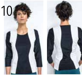
10 TOP 7: LYCRA IN ZWART, ECRU (TST STOFFEN).