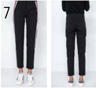
7 BROEK 2: STRETCHSTOF IN ZWART EN ECRU (NOOTEBOOM).