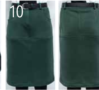
10 ROK 18: STEVIGE SCUBA (NOOTEBOOM).