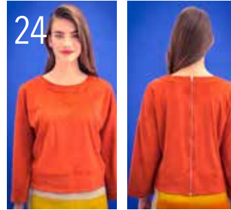
24 SWEATER 12: SUËDINE (NOOTEBOOM).