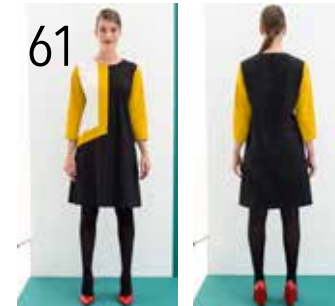
61 JURK 19: POPLIN IN ZWART, OKER, ECRU (TOPTX).