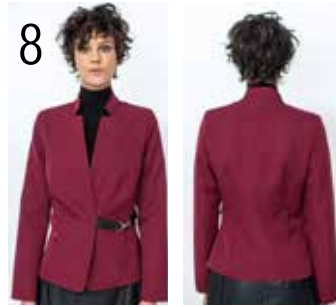
8 JASJE 15: WIJNRODE WOLPOLYESTER (NOOTEBOOM).