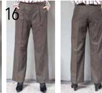
16 BROEK 14: TWEED (TOPTX).