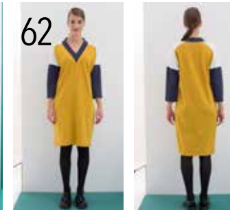
62 JURK 4: PUNTA DI ROMA IN OKER, BLAUW, ECRU (KNIPIDEE).