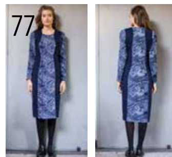
77 JURK 6: PAISLEY-JACQUARD, DONKERBLAUWE PUNTA DI ROMA (KNIPIDEE).