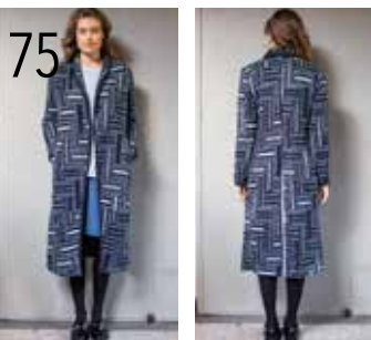
75 VEST 10: WOLLEN BREISEL EN DONKERBLAUWE TRICOT (KNIPIDEE).