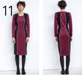
11 JURK 6: BORDEAUXRODE SCUBA (NOOTEBOOM), ZWARTE RELIËFTRICOT (TOPTX).