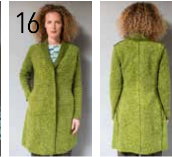
16 VEST 11: BOUCLÉ-ALPACA MET STRETCH (KNIPIDEE).