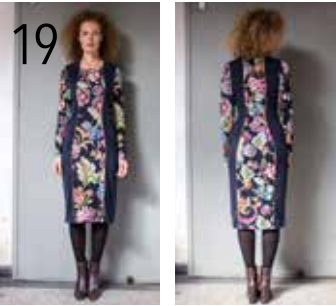
19 JURK 6: TRICOT MET BLOEMENPRINT, DONKERBLAUWE MODALTRICOT (KNIPIDEE).