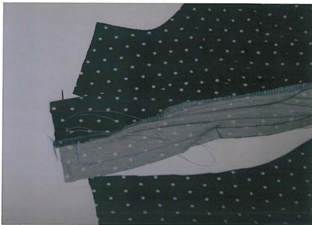
Foto 10 Vouw het beleg bij de zijnaad van de flap van het rechter bovenvoorpand naar binnen en zet de zijnaden op elkaar vast.