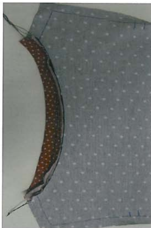
Foto 14b Stik de halsbies, iets uitgerekt, op de goede kant langs de achterhals.