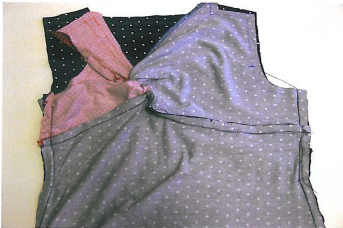
Foto 13 Stik de rechter zijnaad.