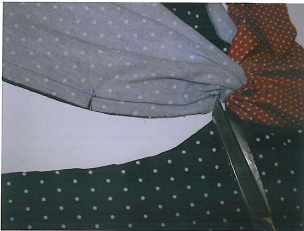
Foto 9 Knip de naad op de tekens tot het stiksel in.