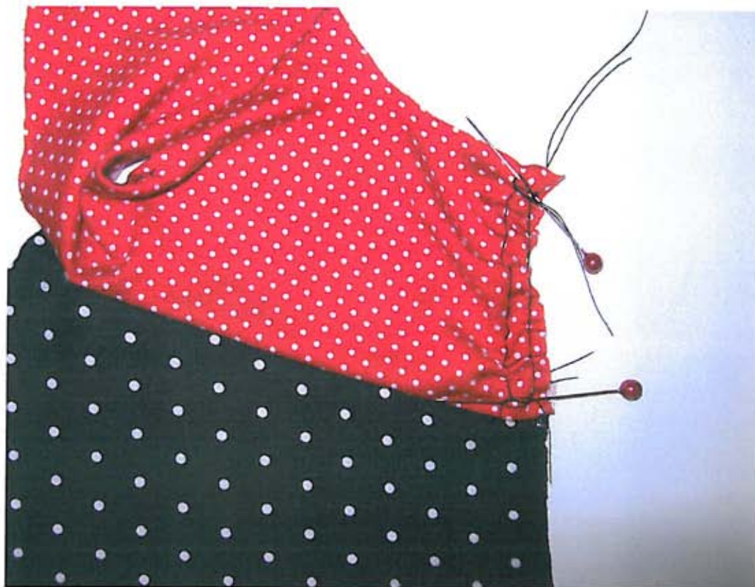
Foto 5 Rimpel de zijnaad van het linker bovenvoorpand in; zie 'Rimpelen' op pag. 31.