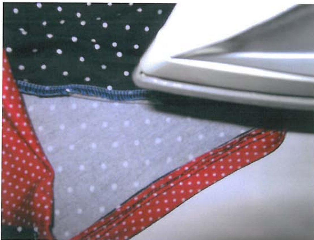
Foto 17 Vouw en strijk het beleg van de bovenvoorpanden verder naar binnen.