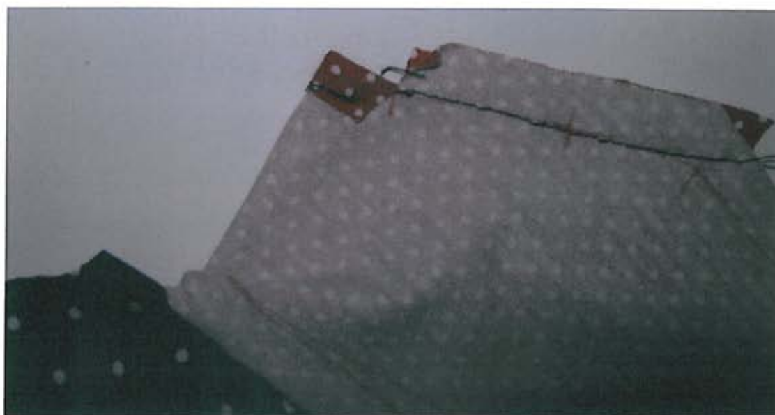
Foto 4 Stik de naad, bij de opening, tegen de binnenkant vast.