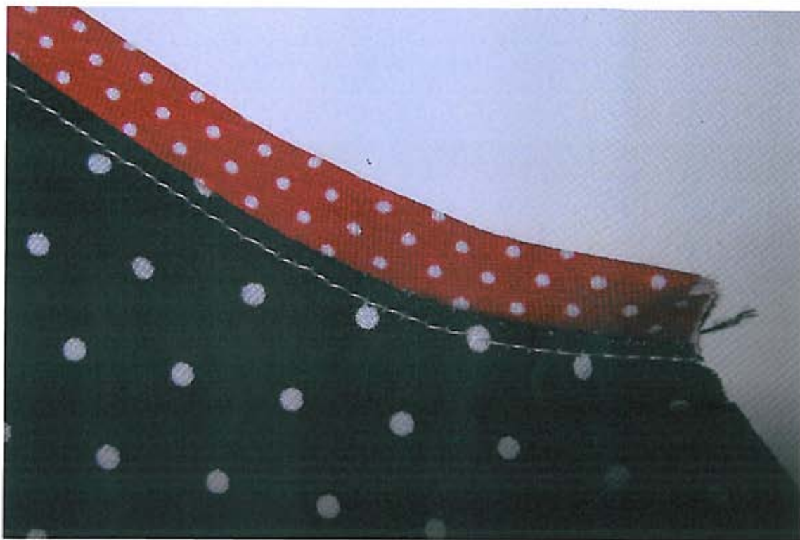
Foto 15 Stik de naad smal op de kant op het achterpand door.