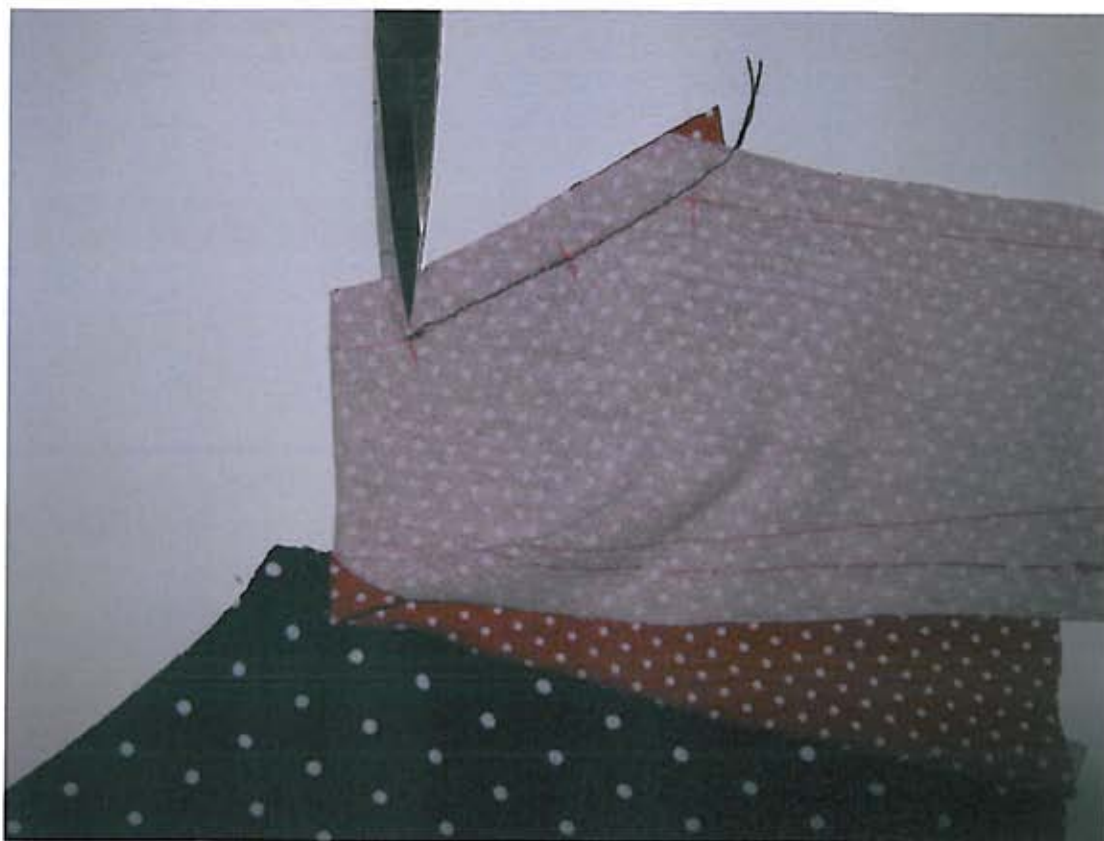
Foto 3 Knip de naad op het teken tot het stiksel in.